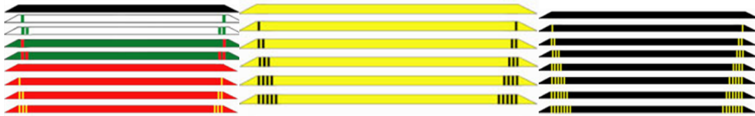
Rajah 2: Menunjukkan Warna Bengkung Atau Tali Pinggang Mengikut Pangkat.

Dalam mempelajari ilmu persilatan, pangkat gurulatih juga diperlihatkan daripada bengkung yang diperoleh. Setiap bengkung yang diperoleh pula merupakan pencapaian seseorang dalam kemahiran menuntut ilmu seni silat. Terdapat beberapa jenis peringkat bengkung dalam pertubuhan Seni Silat Gayong iaitu hitam mulus, awan putih, pelangi hijau, pelangi merah, pelangi merah cula I,II,III, pelangi kuning, pelangi kuning cula I,II,III,IV,V, dan harimau pelangi hitam cula sakti I,II,III,IV,V,VI.