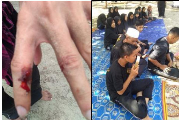
Rajah 5: Menunjukkan Penyakit Fizikal Dan Penyakit Spiritual Yang Menimpa Pelatih.

dengan makhluk ghaib seperti jin. Semasa mengubati pesakit, pelbagai teknik dan helah yang telah digunakan oleh makhluk halus sebelum meninggalkan jasad pesakit dan jika yang menyaksikan rawatan tersebut berkeadaan lemah, kemungkinan besar makhluk tersebut akan berpindah ke badan individu yang menyaksikan rawatan itu.