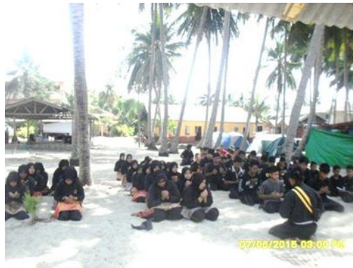
Rajah 6: Menunjukkan Adat Membuka Dan Menutup Gelanggang.